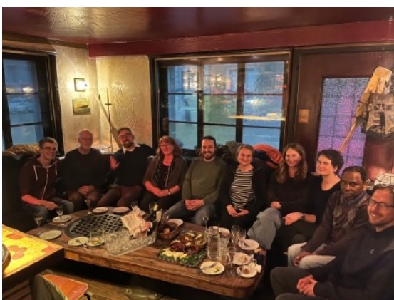
Stamm im Damm im Damm für Dich