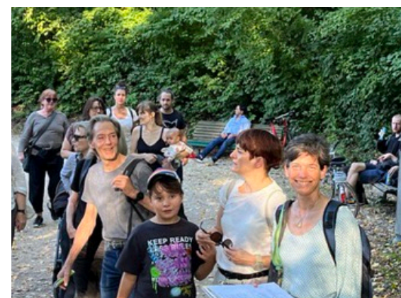
Der Irchel-Park ist Teil eines Vernetzungskorridors