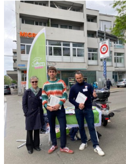
Standaktionen in Höngg und Wipkingen