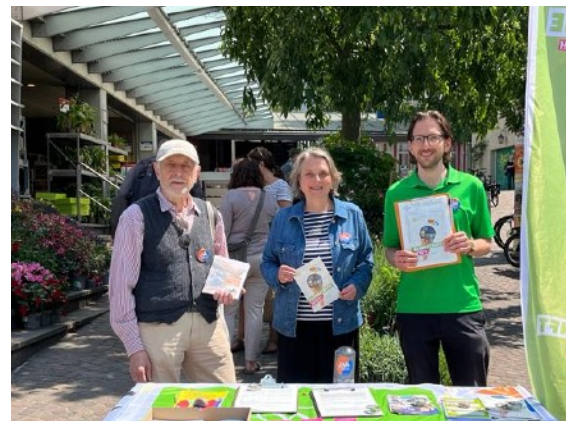
Standaktionen in Wipkingen und Oberstrass