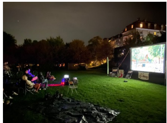
Nächtliche Stimmung während des Films