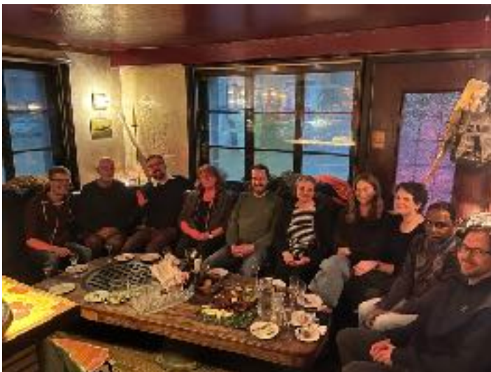
«Stamm im Damm»