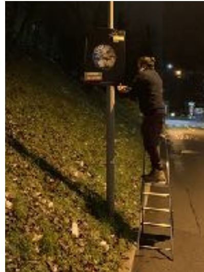
Aufhängen unserer «wilden Plakate» (wiederverwendet von Gemeinderatswahlen)