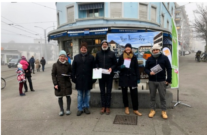
Aktion „Geld verlocken“ am Schaffhauserplatz

Das Jahr 2020 begann sehr erfreulich mit der Ablehnung des Rosengartentunnels an der kantonalen Abstimmung vom 9. Februar. Über unsere Kampagne „Geld verlocken“ mit dem Plakat von Markus Huber, den Standaktionen, dem Flyern und dem Telefonieren aller Ortsparteien der Grünen und der SP im Kanton Zürich, um sie zu Aktionen gegen den Tunnel zu ermuntern, haben wir schon im letztjährigen Jahresbericht geschrieben. Dass ein Jahr später Ernüchterung über das „Wie weiter“ herrscht, war zu erwarten. Das Thema Rosengarten wird nicht zum letzten Mal in einem Jahresbericht erscheinen.